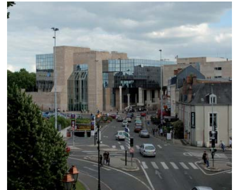
Im modernen Le Mans

Rennwagen der Formel V, Tourenwagen, Motorräder, alles, was viele PS hat und bisweilen viel Lärm verursacht, trifft sich hier im Verlaufe des Jahres. Aber auch das erst kürzlich renovierte Automobilmuseum selbst bietet für Alle etwas. Ich selbst war schon mehrfach dort und immer wieder begeistert von der Ausstellung, die rund 100 Objekte aus dem Beginn der automobilen Zeit bis hin zu den letzten Siegern der 24-Stunden-Rennen umfasst.