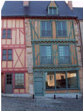
In der Altstadt

Aber auch das moderne Le Mans hat eine Vielzahl interessanter Angebote. Eines davon, das Automobilmuseum an der Rennstrecke des weltberühmten 24-Stunden-Rennens, werden wir besuchen. Eigentlich ist immer etwas los am Rundkurs „Circuit Bugatti“.