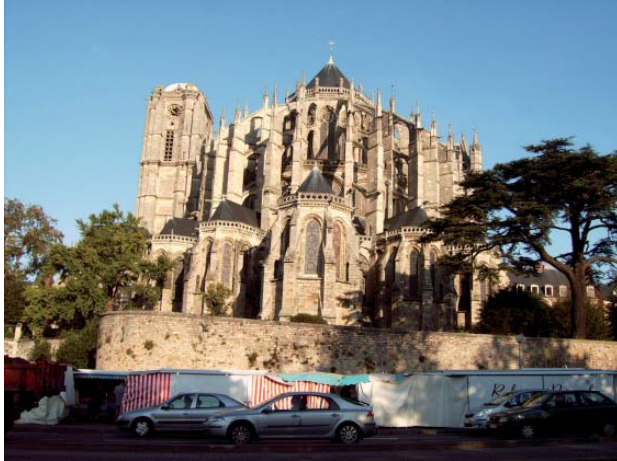
Über dem Marktplatz von Le Mans erhebt sich die im romanisch-gotischen Baustil errichtete Kathedrale Saint-Julien.

Diese Erfahrung habe ich übrigens 1973 im Alter von 17 Jahren erstmals selbst gemacht und anschließend schulisch auf dem Weg bis zum Abitur, aber auch in meinem weiteren Leben von diesen Erlebnissen profitiert.