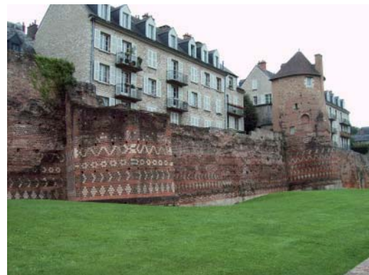
Die alte Stadtmauer

Die Stadt Le Mans ist mit rund 145.000 Einwohnern etwa genau so groß wie Paderborn und hat gemeinsam mit Paderborn die britische Stadt Bolton als Partnerstadt, pflegt daneben aber auch Partnerschaften zu Suzuka (Japan), Haoussa (Westsahara), Rostow am Don (Russland), und Volos (Griechenland).