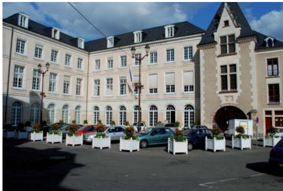
Das Rathaus von Le Mans

Nach einer interessanten, sicher auch anstrengenden Woche ist die Rückkehr für Samstag, 23. Oktober, vorgesehen. Wir werden in Le Mans um 08.00 Uhr losfahren um am späten Nachmittag nach rund 870 Kilometern wieder in Paderborn anzukommen. Den ursprünglichen Termin für die Rückreise (Sonntag, 24.10.2010) konnte ich nach etwas „hin- und her“ ändern, damit wir den Sonntag zur Erholung daheim haben und am darauf folgenden Montag ausgeschlafen zur Schule bzw. zur Arbeit gehen können. Über alles, was zwischen Hin- und Rückreise liegt, sollt Ihr im Folgenden ein wenig erfahren.